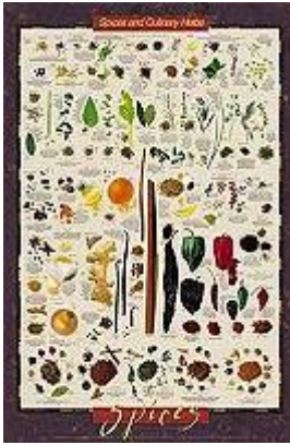
Großes Poster 61 cm x 91 cm.