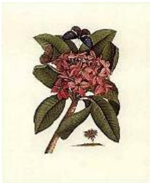
Großer Kunstdruck 49,5 cm x 60 cm.